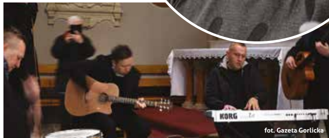
fol. Gazeta Gorlicka