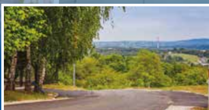
Remonty miejskich ulic - s. 7