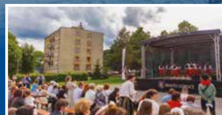
Gorlickie Dni Rodziny za nami - s. 15