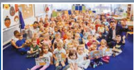
Dzień Dziecka w Gorlicach - s.8-9