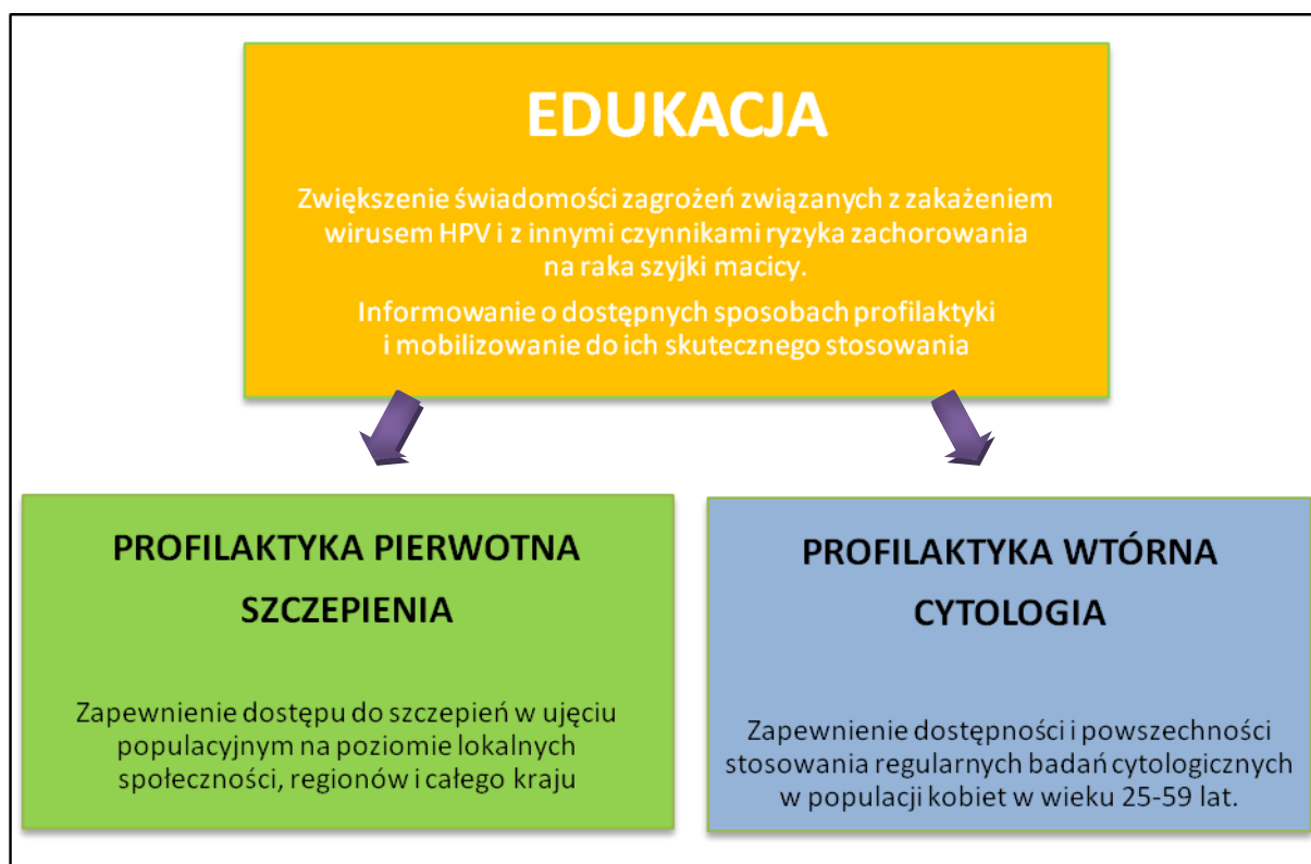
Rys. 1 – Filary SKUTECZNEJ PROFILAKTYKI zakażeń wirusem HPV

Z uwagi na brak finansowania formy profilaktyki jaką są szczepienia, na poziomie centralnym, stopień dostępu do nich w Polsce nie jest zadowalający. Szczepionki dostępne są wyłącznie na rynku prywatnym jako pełnopłatne oraz poprzez programy profilaktyczne realizowane przez jednostki samorządu terytorialnego i inne instytucje w obrębie społeczności lokalnych, samorządów i regionów.