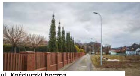
ul. Kościuszki boczna

Nowe ledowe oświetlenie, zyskało 6 gorlickich ulic – dwie ulice boczne od Kościuszki, ul. Graniczna boczna, łącznik ulicy Blich z kładką na rzece Ropie, łącznik ulicy Skrzyńskich z Jagodową oraz Kwiatowa boczna. Łącznik ul. Blich z kładką na Ropie Dbamy o ulice i uliczki - o potrzebie oświetlenia tych części miasta słyszałem od mieszkańców i od radnych. Nowe lampy z pewnością wpłyną na komfort dojazdów do posesji i poprawią bezpieczeństwo – mówi burmistrz Rafał Kukła. Wszystkie wymienione miejsca zyskały nowe słupy z wysięgnikami i oprawami ledowymi.