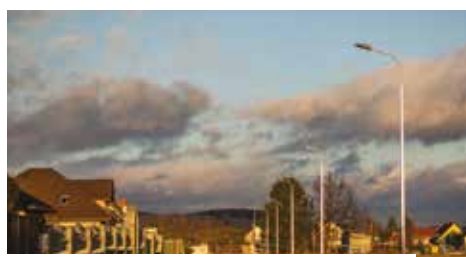
Łącznik ul. Skrzyńskich z ul. Jagodową