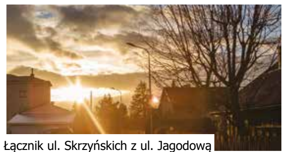
Łącznik ul. Skrzyńskich z ul. Jagodową

Nowe ledowe oświetlenie, zyskało 6 gorlickich ulic – dwie ulice boczne od Kościuszki, ul. Graniczna boczna, łącznik ulicy Blich z kładką na rzece Ropie, łącznik ulicy Skrzyńskich z Jagodową oraz Kwiatowa boczna. Łącznik ul. Blich z kładką na Ropie Dbamy o ulice i uliczki - o potrzebie oświetlenia tych części miasta słyszałem od mieszkańców i od radnych. Nowe lampy z pewnością wpłyną na komfort dojazdów do posesji i poprawią bezpieczeństwo – mówi burmistrz Rafał Kukła. Wszystkie wymienione miejsca zyskały nowe słupy z wysięgnikami i oprawami ledowymi.