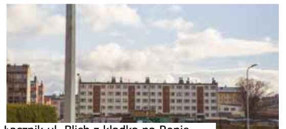
Łącznik ul. Blich z kładką na Ropie