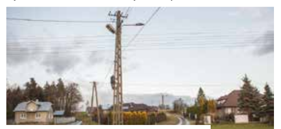
ul. Kwiatowa boczna