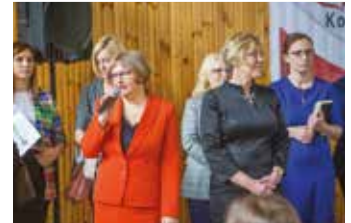
fol. Marcin Gugulski

„Marszałek Sejmu RP, który przekazał dla zwycięzców trzy tablety. Ponadto wzorem lat ubiegłych wszyscy uczestnicy konkursu oraz ich opiekunowie otrzymają dyplomy i bogate upominki stanowiące podziękowanie za