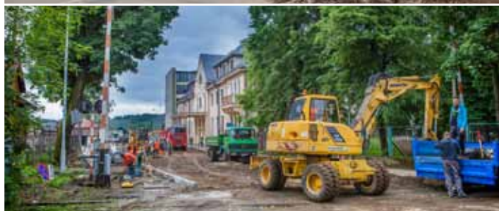
Fot. Teodor Włosek