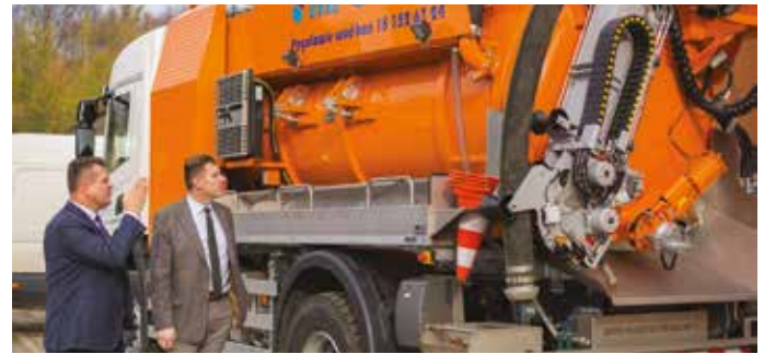
fol. Marcin Gugulski